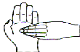
6. 指尖在掌心中搓擦