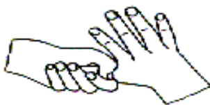
5. 拇指在掌中转动搓擦